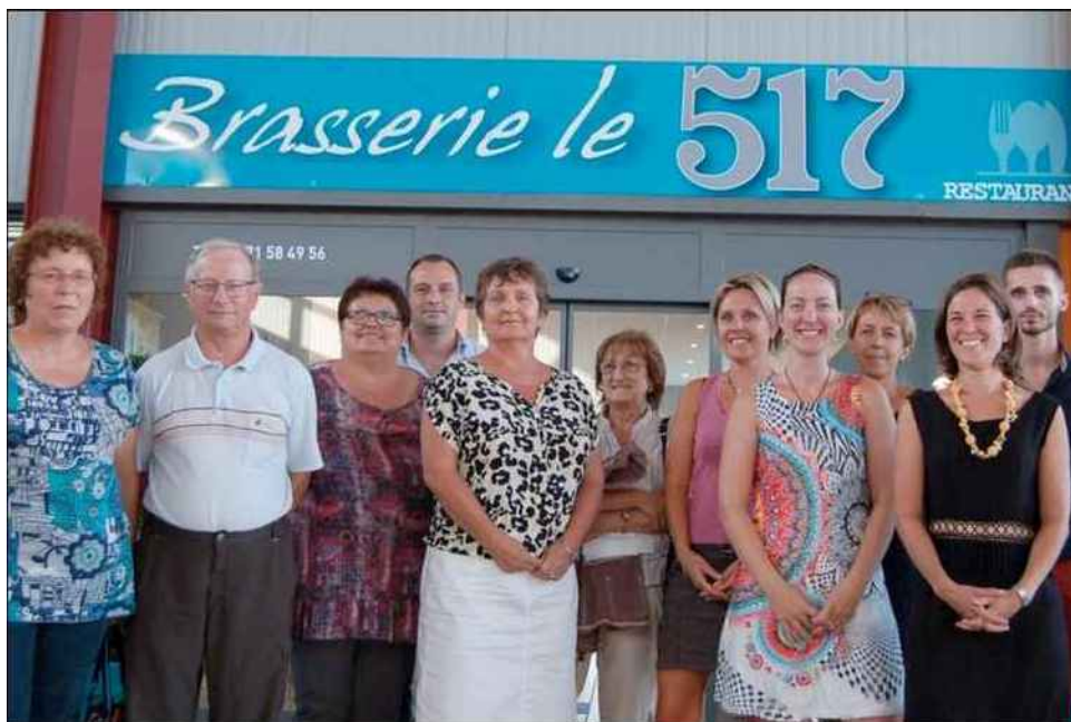
■ De nombreux acteurs sociaux et institutionnels se sont fédérés autour de cette initiative.

CONTACT Tél. 0805 690 376 (numéro gratuit).