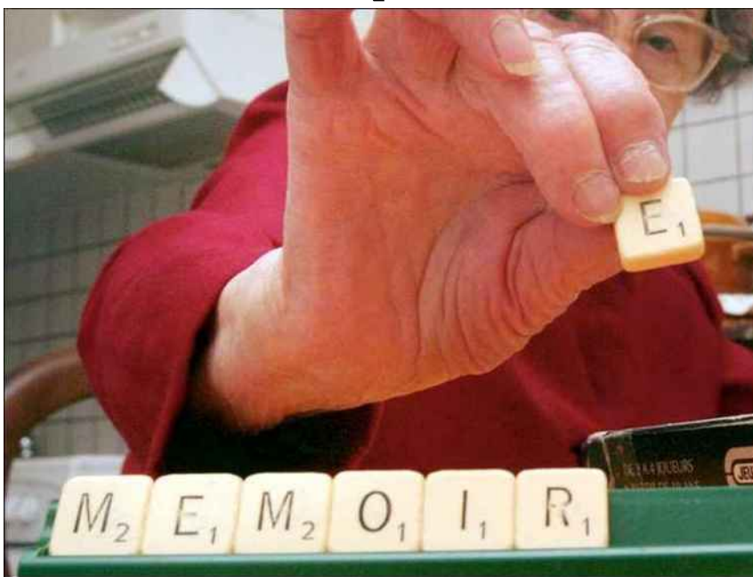
■ Les participants pourront venir se changer les idées, mais aussi se renseigner sur les pathologies de la mémoire.

Ces rencontres auront ainsi lieu chaque troisième jeudi du mois et seront coanimées par des professionnels de la mémoire (psychologues, assistantes sociales, aides médico-psychologiques, aides-soignantes, etc.). Mais pas