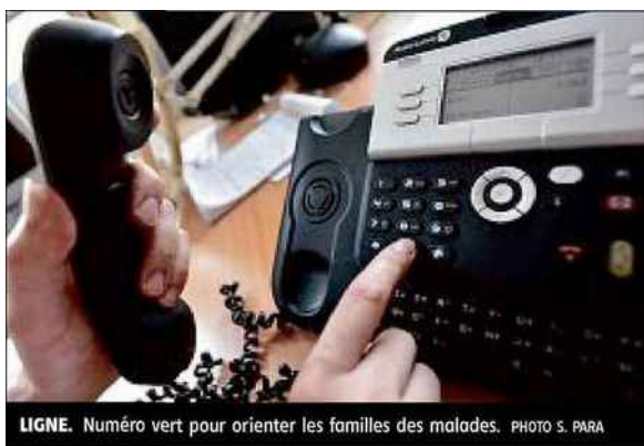
LIGNE. Numéro vert pour orienter les familles des malades.

Les aidants ont besoin d'autant de soutien que les malades